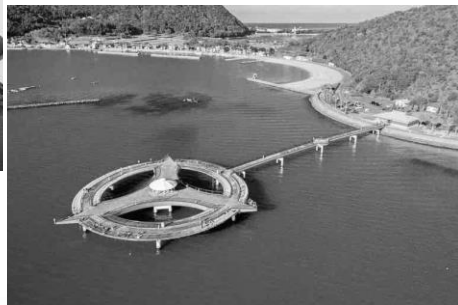
あかぐり海釣り公園

標高800mの丹波高地を挟み、高浜町、おい町名田庄、南丹市美山町、京都市右京区京北、京都市北区、そして京都御所を結ぶ約70kmの街道。