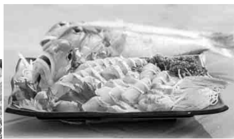
若狭甘鯛 ブランド化を推進