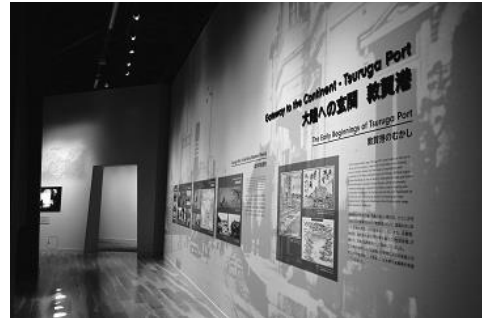
大陸への玄関 敦賀港