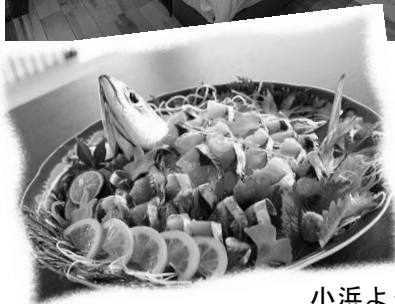
深い甘みと うまみを持つ 小浜よっぱらいサバ