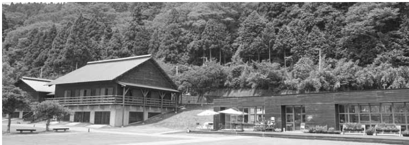
青葉山ハーバルビレッジ