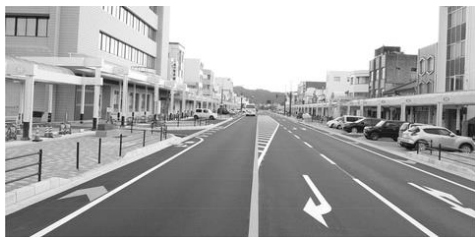
国道8号 元町交差点 白銀交差点間再整備 にぎわいを楽しみながら回遊できる歩行空間を創出(左)