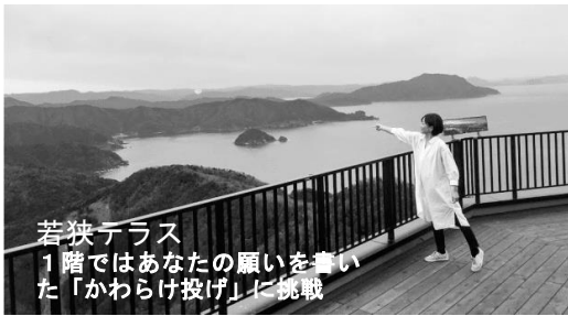
若狭テラス 1階ではあなたの願いを書いた「かわらけ投げ」に挑戦

今年4月、レインボーライン山頂公園におしゃれなテラスが5カ所オープン。お気に入りのテラスでじっくりと異なった景色が楽しめ、今までになかった雨風がしのげる快適な建屋も完成。大パノラマが楽しめる国内の景勝地にはない圧倒的な魅力の山頂公園が全天候型の山頂公園として生まれ変わった。