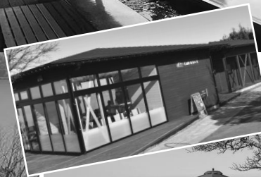
山頂カフェ 「なないろ」 中央テラス