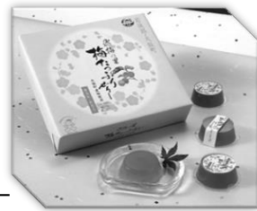
梅たっぷりゼリー