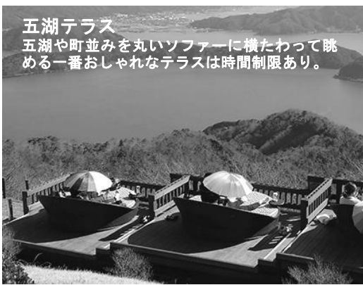
五湖テラス 五湖や町並みを丸いソファに横たわって眺める一番おしゃれなテラスは時間制限あり。