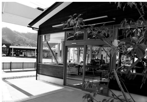
「小浜市インフォメーションセンター」 JR小浜駅前に整備、市内はもとより近隣市町の観光地 情報やイベント情報を提供。英語を話せる職員も在籍。