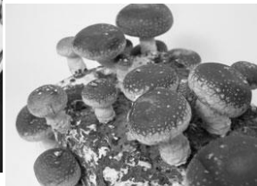
錦賞しいたけ 「お～いしいたけ」 通販で大人気。