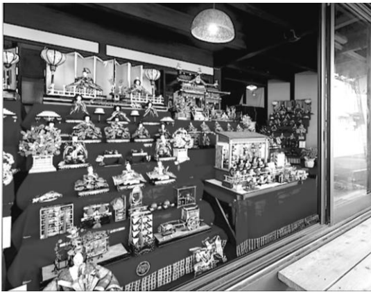
若狭高浜ひなまつり 若狭街道(旧丹後街道)沿いに並ぶ 商店や民家に自慢の雛人形が並ぶ。