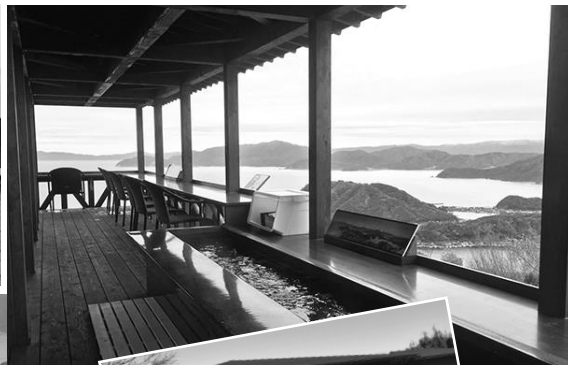
美浜テラス 天空の足湯とカウンターテラス