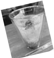
薬膳クラフト ジンジャエール