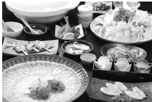
冬の味覚「若狭ふぐ」