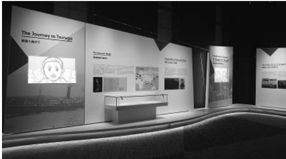
ポーランド孤児展示

敦賀市金ヶ崎町 23-1 入館料 一般 大人 500 円、小学生以下 300 円団体 (20 名以上) 大人 400 円、小学生以下 240 円※4 歳未満無料、障がい者およびその介護者 1 名は無料 営業時間 9:00～17:00 (入館は 16 時 30 分まで) 休日 水曜日 (祝日の場合は翌日)、年末年始 電話 0770-37-1035