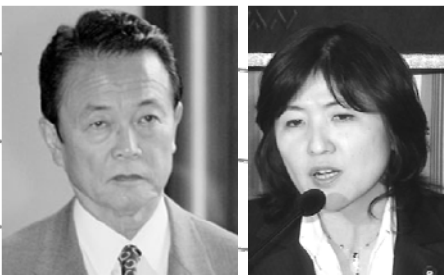
麻生財務大臣と稲田行革大臣