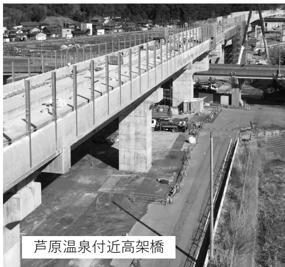
芦原温泉付近高架橋