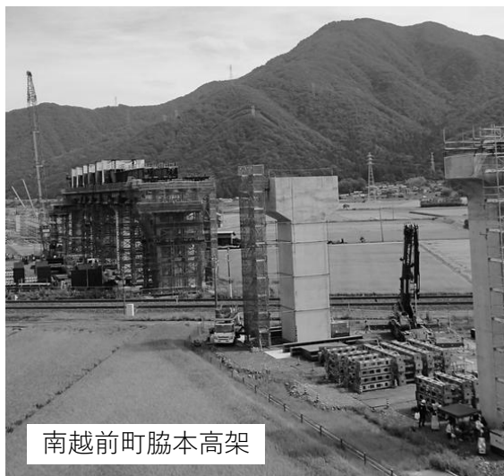
南越前町脇本高架