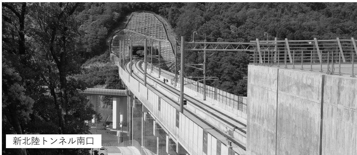
新北陸トンネル南口